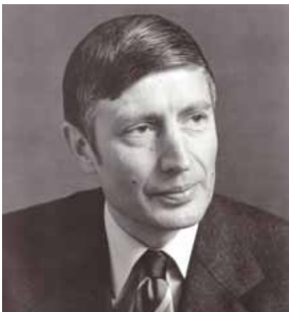
Oud-premier Dries van Agt.

Organisatieadviseur bij PNO Management Consultants te Hengelo. Vervolgens vijf jaar senior beleidsmedewerker regionaal economisch beleid bij de provincie Overijssel. Afgelopen vijf en half jaar werkzaam bij de Universiteit Twente en verantwoordelijk voor de gebiedsontwikkeling Kennispark Twente. Sinds december 2010 campusmanager van de Universiteit Twente.