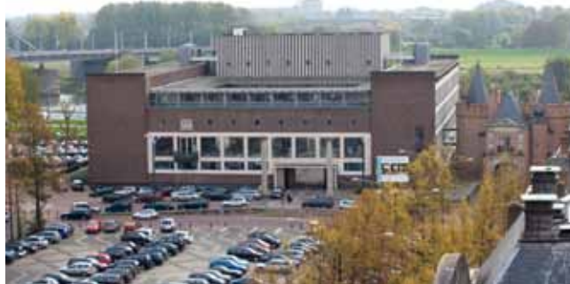
De brochure is bestemd voor alle CDA-politici of ze nu lokaal, provinciaal, nationaal of Europees werken (foto provinciehuis Gelderland).

In de brochure Betrouwbaar CDA-politicus is een aantal politieke dilemma's opgenomen die ook in de praktijk voorkomen. Het gaat bijvoorbeeld om de volgende casus: Onverwacht wordt bij een fractievoorzitter een kerstpakket bezorgd van een bedrijf waarvoor de fractie met succes in de bres is gesprongen. De fractievoorzitter stuurt het pakket met een vriendelijk briefje retour. Later blijkt in de fractievergadering dat ook andere fractieleden een pakket hebben ontvangen. Daar is verschillend mee omgegaan. De een heeft het teruggestuurd, anderen hebben het aangenomen maar aan de voedselbank gegeven of aan de huishoudelijke hulp (die het goed kon gebruiken). Na enig gereken kwam de fractie tot de conclusie dat het pakket minder dan 50 euro waard was. Vraag: wat is de beste reactie van de fractievoorzitter?