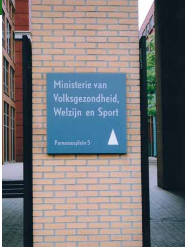
Decentralisatie van de WMO heeft laten zien dat het rijk moeite heeft met 'loslaten' en graag een vinger in de pap houdt.

regionale arbeidsmarkt gestalte krijgen.' Hij benadrukt dat het decentralisatiepakket geen opmars is voor een grootschalige herindeling. 'We hebben geen verborgen agenda en hebben juist rekening gehouden met de kleinere gemeenten. Zo hebben we er bewust op ingezet dat de Wet werken naar vermogen niet volgend jaar, maar pas per 1 januari 2013 ingaat. Dan kunnen gemeenten zich hier goed op voorbereiden. Door te kiezen voor differentiatie van de uitvoering, kan gedwongen herindeling worden voorkomen. Als gemeenten uiteindelijk zelf kiezen voor een herindeling, dan is dat prima. Maar zelf verwacht ik dat er vooral meer zal worden samengewerkt. Veel kleinere gemeenten werken al samen op diverse gebieden. Het past ook bij de tijdgeest. Iedereen moet bezuinigen en men zoekt naar mogelijkheden om elkaar te versterken. Deze tijd van bezuinigingen leidt bestuurlijk tot veel inventiviteit.'