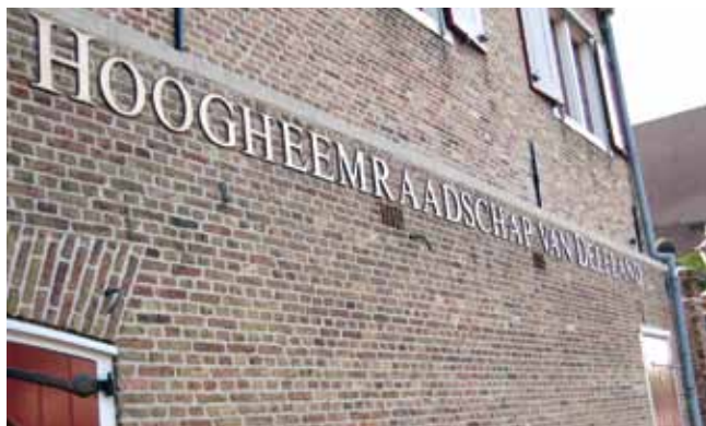
De samenwerking heeft zowel voor het Hoogheemraadschap als de gemeente Maassluis een groot aantal voordelen opgeleverd.

Aan de samenwerking tussen waterschap en gemeenten in de afvalwaterketen wordt op diverse manieren gestalte gegeven. Het Hoogheemraadschap van Delfland (hierna: Delfland) heeft met alle gemeenten in het beheersgebied afgesproken de mogelijkheden te verkennen. Op het schaalniveau van een gemeente rond de 30.000 inwoners bleek al eerder dat besparingen mogelijk zijn. Zo heeft Delfland goede ervaringen met de gemeente Maassluis. Hiermee werd al op 1 november 2005 een afvalwaterakkoord gesloten om de mogelijkheden tot samenwerking te verkennen. Deel van dit akkoord was een onderzoek naar de voordelen die zich kunnen voordoen als het beheer en onderhoud van de gemeentelijke rioolgemalen door Delfland zou worden uitgevoerd. Dit onderzoek leverde in 2007 al een aantal positieve resultaten op, zowel voor gemeente als waterschap.