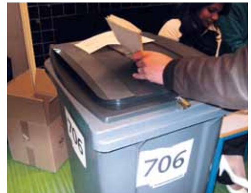
Wat voor verkiezing er ook komt: er moet in ieder geval rust ontstaan voor het waterschapsbestel op de langere termijn.

In de afweging moet het voortbestaan van functionele, democratisch gelegitimeerde waterschappen centraal staan. Vervolgens moet gewaarborgd zijn dat ze ingebed zijn in het algemeen bestuur, juist vanwege die ene fundamentele waterveiligheid- en watersysteemtaak. Met deze premisse liggen twee wegen open. Of de verkiezingen blijven direct omdat de stem van de burger over zijn water direct moet doorklinken in het rechtstreeks gekozen bestuur. Of het risico