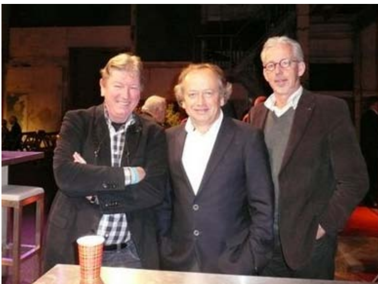
Foto: Hermen de Graaf (links) en Jaap Overbeek (rechts) met staatssecretaris Henk Bleker.