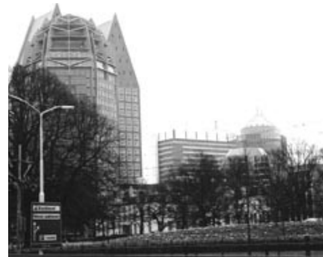
Het is zinvol de Haagse regelgeving, en dan vooral de systematiek, tegen het licht van de bevolgingsafname te houden.

Alle prognoses wijzen uit dat ons land op termijn qua bevolking gaat krimpen. Nu al zien we een bevolgingskrimp in veel landelijke gebieden, vooral in het Noorden en Zuid-Nederland. Bestuurders van gemeente, regio en provincie worden aangesproken op de gevolgen. Vraag is hoe deze CDA-bestuurders moeten reageren en wat op dit moment verstandige keuzes zijn. In dit nummer komt een aantal CDA-bestuurders hierover aan het woord.