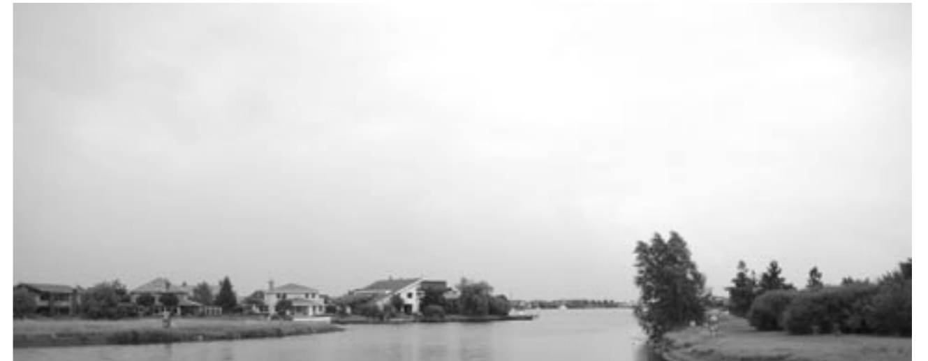
In reactie op de krimp kiest men er vaak voor om de kwaliteit van de woningvoorraad te vergroten en de werkgelegenheid te stimuleren om zo meer (jonge) inwoners te trekken.

Ook de ontwikkeling van De Blauwe Stad in Oost-Groningen past hierin. Het gebied kampte met verscheidene problemen: sterke vergrijzing, het wegtrekken van jongeren in verband met het ontbreken van werk, braakliggende landbouwgronden en tot overmaat van ramp brachten de traditionele