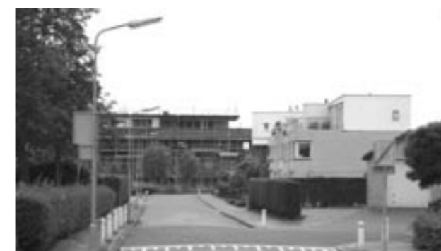
De komende 25 jaar moet in Zeeland nog wel worden gebouwd, maar hierbij moet wel rekening worden gehouden met de sterk wijzigende samenstelling van de bevolking.

Dit betekent dat wij de komende 25 jaar moeten blijven bouwen voor de groei van het aantal huishoudens. Wel moet hierbij rekening worden gehouden met de sterk wijzigende samenstelling, die het noodzakelijk maakt in het woningbouwprogramma hier op in te spelen en bestaande woningen versneld aan te passen, dan wel te saneren. Ook in de categorie particuliere koopwoningen zullen overschotten ontstaan, omdat de betreffende woningen niet meer aan de woonwensen voldoen.