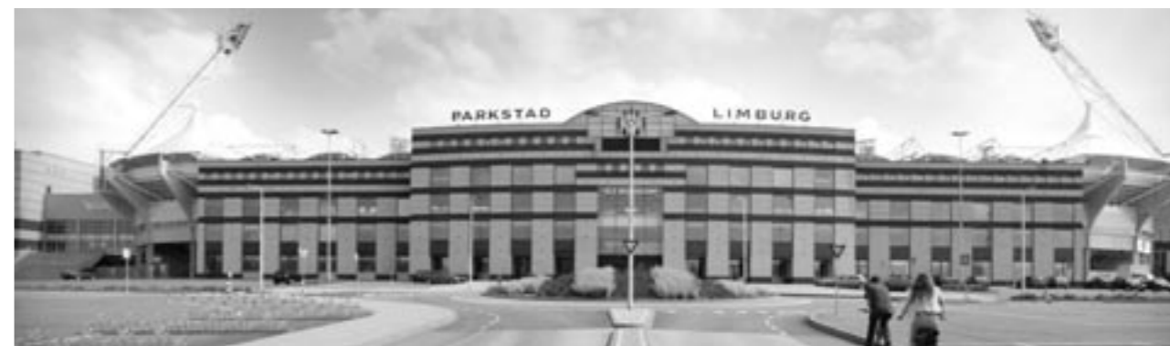
Parkstad Limburg Stadion waar Roda JC de thuiswedstrijden speelt.

'Daarnaast speelt er natuurlijk veel meer, zoals investeringen in sociale infrastructuur die bij vergrijzing en ontgroening een belangrijke rol spelen. Denk bijvoorbeeld alleen al aan de gigantische opgaven en de noodzakelijke fusies en