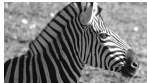
Gaiapark Kerkrade Zoo, een van de grote investeringen om de regio aantrekkelijk te maken voor toeristen.

'Jazeker. We hebben zwaar gesloopt en (her-)nieuwe(de)