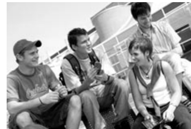
De potentiële beroepsbevolking in Zeeland zal de komende dertig jaar met 13,5 procent afnemen (foto campus Hogeschool Zeeland).

Op grond van deze gegevens voert de provincie nu al in nauwe samenwerking met de Zeeuwse gemeenten en het bedrijfsleven een actief beleid om zoveel mogelijk mensen te (blijven) activeren voor de arbeidsmarkt: herintreders, vrouwen en zestigers. Wij doen dit om aan de vraag naar arbeids-