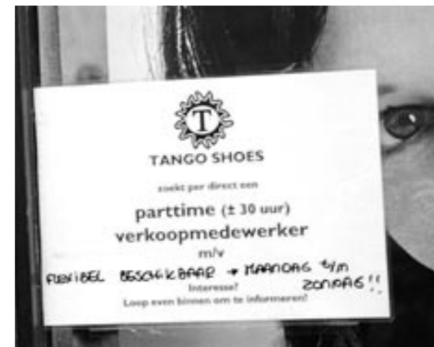
Het zal steeds lastiger worden om vacatures te vullen.

De omvang van de potentiële beroepsbevolking (alle personen tussen de 20 en 65 jaar) heeft de afgelopen jaren haar hoogste punt bereikt en zal de komende tijd alleen maar dalen. Het CBS verwacht dat tussen nu en 2040 de potentiële beroepsbevolking afneemt van tien naar negen miljoen. In 2005 was er al een lichte afname te merken, maar