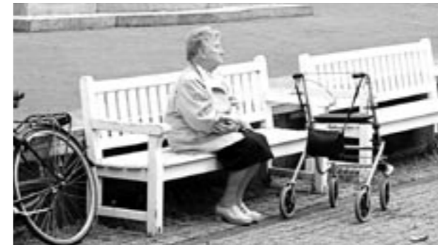
We moeten ervoor waken de vergrijzing alleen als probleem te zien.

ken aantrekkelijk maken niet langer fiscaal te stimuleren. Ook is de sollicitatieplicht voor werknemers ouder dan 57,5 jaar opnieuw ingevoerd. De komende jaren zullen aanvullende maatregelen onontkoombaar zijn. Werkgevers zullen zich er van bewust moeten worden dat zij te maken krijgen met meer ouderen in hun personeelsbestand. Dit betekent dat zij een leeftijdsbewust personeelsbeleid moeten voeren en moeten blijven investeren in scholing en training van oudere werknemers. Vooroordelen over vermeende inflexibiliteit moeten via goede voorbeelden worden bestreden. Oudere werknemers bren-