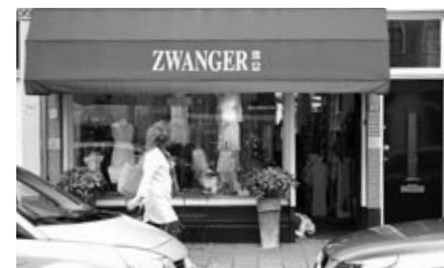
Om de Nederlandse bevolking stabiel te houden, zou het geboortecijfer gemiddeld 2,1 kind moeten zijn. Het is echter al dertig jaar 1,7.

met een nieuwe aantrekkelijke woonwijk mensen te trekken. Als dit al lukt, moet je als gemeente wel goed beseffen dat je een andere gemeente in je regio met een probleem opzadelt, want die verliest waarschijnlijk inwoners. Gemeenten moeten zich realiseren dat ze allemaal in dezelfde vijver visen die alleen maar kleiner wordt. Bevolkingskrimp vraagt dus ook om een nieuw soort onderlinge solidariteit tussen gemeenten.’