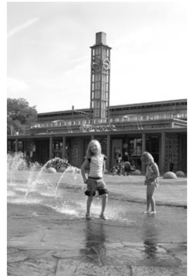
Op bepaalde plekken worden markante gebouwen neergezet. Zo komt bij het station een WTC-gebouw. (foto Stationsplein Hengelo).

genheid een plek geven: bouwen voor de toekomst. Daarom kijken we hoe we experimenteel kunnen werken door buiten de kaders te denken. Die nieuwe vormen (persoonlijke economie) een kans geven, dat vind ik een uitdaging. ‘Maar we gaan verder. Er is een vitale coalitie van gemeente, woningcorporaties, ondernemers en FC Twente. FC Twente traint namelijk in Berflo Es en de jeugdopleiding van FC Twente (en Heracles) is daar gevestigd. De spelers hebben de wijk geadopteerd en de spelers zijn echte rolmodel-