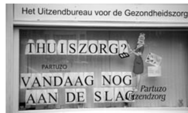
De zorg is één van de sectoren waar problemen met de personeelsvoorziening worden verwacht.

De snel veranderende samenleving maakt het noodzakelijk om kennis en vaardigheden op peil te houden. Bovendien moeten werknemers flexibel kunnen inspelen op veranderingen in hun leven, bijvoorbeeld als zij betaald werk willen combineren met zorg voor kinderen of ouders, om- of bijscholing of vrije tijd. Het CDA hecht er aan dat gezinnen in staat worden gesteld om werk en zorgtaken te combineren, onder meer door de kindertoeslag te verhogen, het ouderschapsverlof uit te breiden en de kinderopvang te verbeteren. De levensloopregeling is één van de faciliteiten die werknemers in staat stelt om te schakelen tussen levensfasen door met gespaard geld een (tijdelijke) terugval in het inkomen op te vangen. In het coalitieakkoord is afgesproken dat de levensloopregeling verder wordt uitgebreid en aantrekkelijker gemaakt, zodat het mensen in de volle lengte van hun arbeidzame leven ondersteunt. Ook kan met behulp