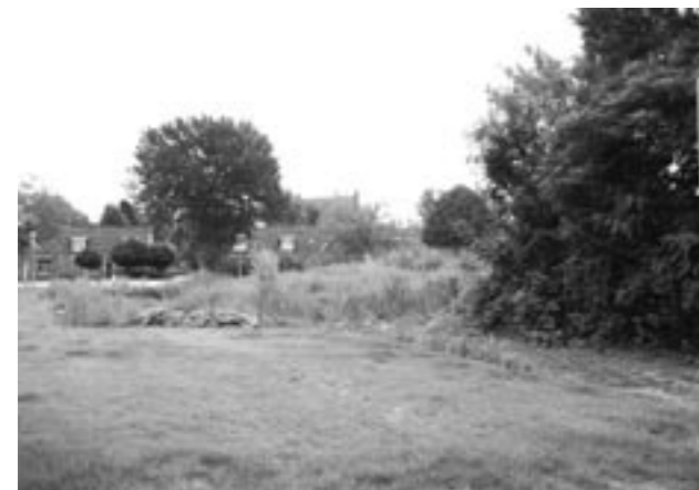
Een aantal gemeenten op het platteland heeft al te maken met bevolgingsdaling.

De redactie van Bestuursforum vroeg een aantal CDA-bestuurders in Oost-Groningen, Friesland en Drenthe naar het beleid op vergrijzing en krimp. In de reacties kwam naar voren dat de plattelandsgemeenten die met krimp te maken hebben wel nadenken om op diverse beleidsterreinen bij te sturen. Maar veelal ontbreekt het nog aan concrete afspraken of een aanpak waarmee aan de slag kan worden gegaan. Het valt ook niet te ontkennen dat het voor bestuurders van