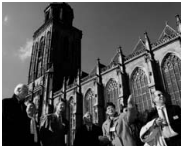
's Middags was er voor belangstellenden een rondleiding door het historische centrum van Deventer.