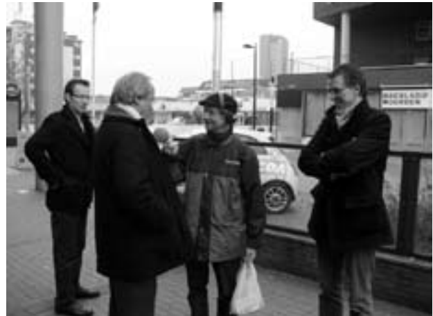
Bedenk van te voren wat je wilt bereiken met je media-optreden.

De derde wet is oefenen. Natuurlijk is een professionele mediatrainer ideaal. Maar duur en niet echt noodzakelijk. Vraag een kritische collega, vriend of partner vragen te stellen, laat je het vuur aan de schenen leggen. Maak zo een lijst met te verwachten vragen en antwoorden vanuit je kernboodschap, kijk goed naar jezelf en laat anderen goed naar jou kijken. Niet alleen je fans, maar organiseer vooral je eigen kritiek.