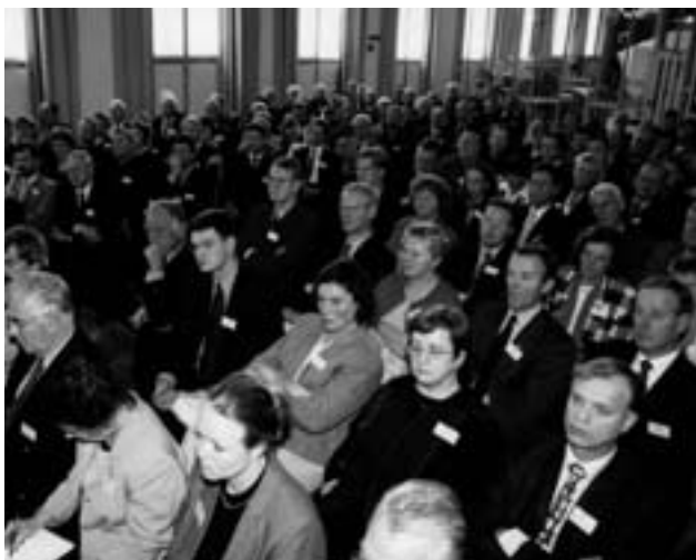
Bij de eerste Bestuurdersdag waren er ongeveer 150 deelnemers.