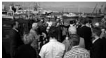
Bezoek aan de Eemshaven in Eemsum.

Het onderwerp energie, met name gas, stond centraal. 's Middags waren er excursies naar Nationaal Landschap Middag-Humsterland, het oudste cultuurlandschap van Nederland, en Groningen Seaports, de beheerder van de haven van Delfzijl, de Eemshaven en aangrenzende industrieterreinen. Volgend jaar is er in verband met de Statenverkiezingen geen Statendag. In 2012 zal Zeeland de Statendag organiseren.