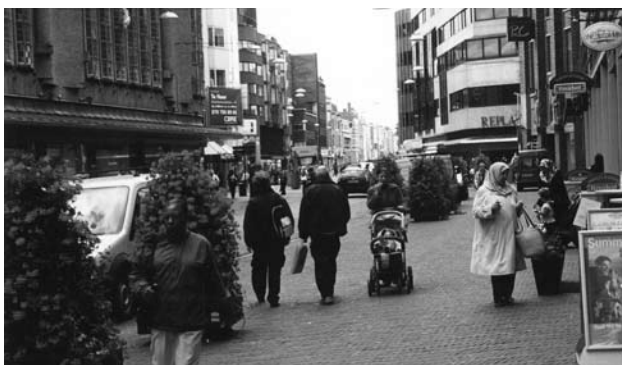
Met de nieuwe regeling moet het aanvragen van een vergunning voor burgers en bedrijven doelmatiger verlopen.

Over de eerste doelstelling schreef ik de vorige keer. Deze keer richt ik mij op de coördinatie-regeling, die bedoeld is om de informatievoorziening en de vergunningverlening doelmatiger te doen verlopen.