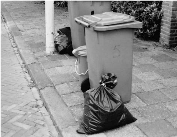
Afvalverwijdering is een van de posten waar samenwerkingsverbanden veel geld aan uitgeven.

veel gemeenteraden is er een dualistische debatcultuur ontstaan. Binnen samenwerkingsverbanden is het echter zaak voorzichtig te polderen, want de besluitvorming daar verloopt in beginsel bij unanimiteit. Altijd is er de kans dat een gemeente die zich overruled weet, uit het samenwerkingsverband stapt (vetomacht).