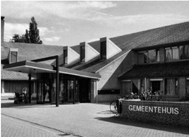
De wethouderskwestie heeft de verhoudingen in het Duivense gemeentehuis op scherp gezet.

niet in slaagt een passende woning te vinden binnen de termijn van een jaar. Het kan toch niet de bedoeling zijn, aldus de VNG, dat de raad een goed functionerende wethouder om die reden letterlijk naar huis moet sturen?