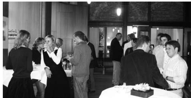
De Netwerkbijeenkomst jonge bestuurders werd gehouden in het stadhuis van Utrecht.