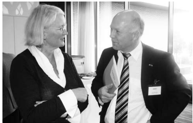
Links Greetje de Vries, Eerste Kamerlid, rechts Pieter van der Vinne, bestuurslid Bestuurdersvereniging en wethouder van Tubbergen.