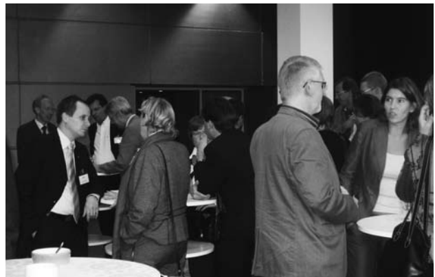
De borrel na afloop.