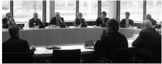
Workshop lokaal armoedebeleid.