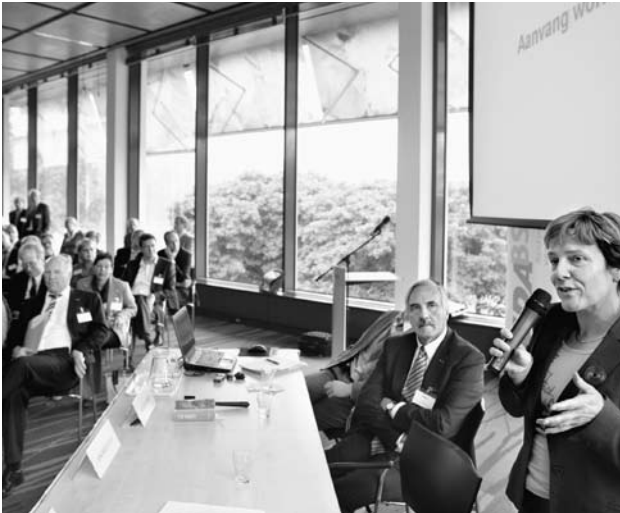
Staatssecretaris Ank Bijleveld zet hoog in op het verbeteren van de dienstverlening van de overheid.

zit te wachten op een gemeentelijke loket waar hij niet goed geholpen wordt.'