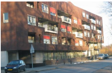
Woningen voor starters en senioren