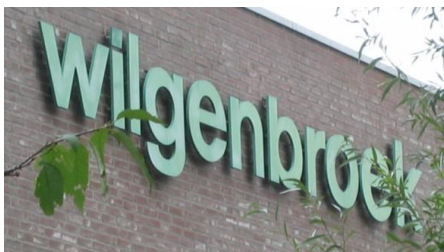
Brede scholen: scharnierpunt van de wijk

116. Bijzondere aandacht voor de deelname aan sportactiviteiten door vrouwen en meisjes.