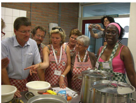
De Smaak van Boxtel: 'meedoen'

Al heel lang wonen er in de gemeente Boxtel inwoners met een buitenlandse afkomst. Deze inwoners brengen de potentie mee om een positieve impuls te geven aan de gemeenschapszin en culturele diversiteit in Boxtel, Liempde en Lennisheuvel. Een belangrijke randvoorwaarde is dat de gemeente extra aandacht besteedt aan de participatie van nieuwe inwoners met een buitenlandse afkomst. Voor kinderen en jongeren heeft de gemeente Boxtel lopende activiteiten met de focus op het bevorderen van scholing, opleiding, sport, spel en arbeidsdeelname. We dienen echter ook blijvend aandacht te geven aan de deelname van de kwetsbaren onder deze bevolkingsgroep. Zeker in tijden van economische tegenslag. Het 'meedoen' van deze belangrijke bevolkingsgroep is een verrijking voor onze gemeenschap.