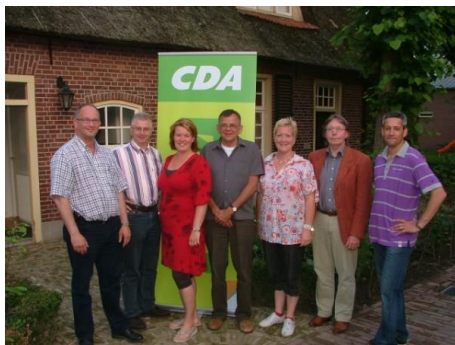
Het algemeen bestuur van het CDA Boxtel-Liempde