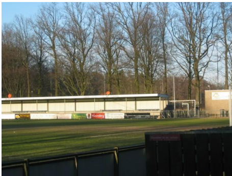
Een centrale accommodatie voor ODC

tot bloei te laten komen. Ouders, onderwijs, sport, cultuur en werkgevers hebben in deze een bijzondere verantwoordelijkheid. Gezamenlijk hebben zij een belangrijke rol in de overdracht van de gemeenschappelijke waarden en normen van onze gemeenschap. Ook bieden zij samen het palet aan voorzieningen die jongeren het nodige kunnen bieden in hun persoonlijke ontwikkeling. Een kleine groep onder de jongeren krijgt problemen in deze levensfase. De gemeente heeft mede de verantwoordelijkheid om deze groep onder de jongeren weer op het juiste pad te brengen. Jongeren verdienen deze kans.