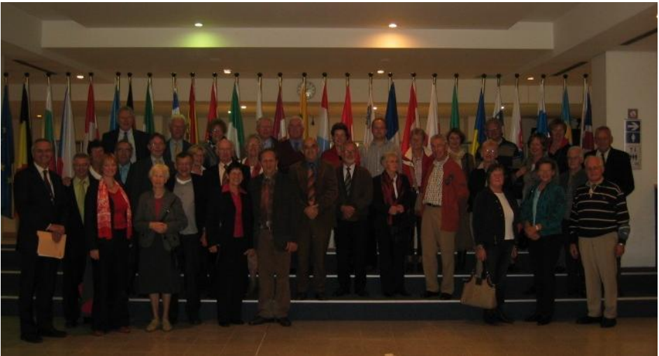
Met zijn allen op excursie naar het Europees Parlement in Brussel