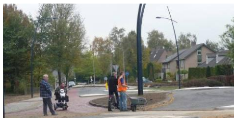
Veilige oversteken langzaam verkeer

De ouderen vormen een groeiend deel van de bevolking van onze gemeente Boxtel. Zij zijn al jarenlang actief in de gemeenschap en hebben in vele opzichten bijgedragen aan de welvaart en het welzijn in Boxtel, Liempde en Lennisheuvel. Veel ouderen zijn meer dan bereid om hun kennis en ervaring in te zetten voor de bloei van de gemeente Boxtel. Onder meer via vrijwilligerswerk in de kerken, verenigingen en zorgverlening. Daarmee voorzien de ouderen in een groeiende behoefte aan zorg en aandacht voor de medemens in onze gemeenschap. Naast de actieve ouderen is ook een deel van de ouderen hulpbehoevend. Voor deze groep dienen alle noodzakelijke voorzieningen te worden getroffen, opdat ouderen zo volwaardig mogelijk deel kunnen uitmaken van de gemeenschap. Ouderen vragen weinig en brengen veel.