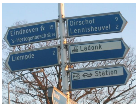
Boxtel, middelpunt van het Groene Woud