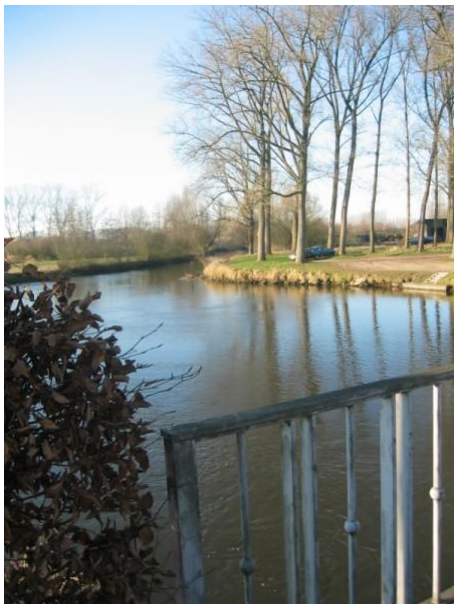
Boxtel is een groene gemeente

De gemeente Boxtel is een groene woon- en werkgemeente met woonvoorzieningen, natuurgebieden en bedrijventerreinen. Liggend in het hart van een gebied tussen de drie grootste steden in Noord-Brabant is de gemeente Boxtel goed bereikbaar via de snelweg of per spoor. Boxtel, Liempde en Lennisheuvel hebben samen 30.240 inwoners die wonen in 12.218 woningen op 6500 hectare.