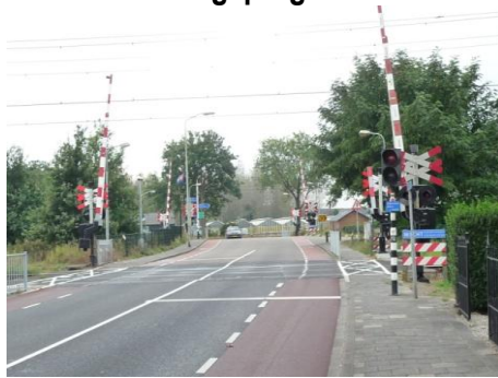
Problematiek van de dubbele overweg