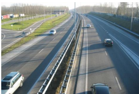
Aanleg van een parallelwegenstructuur