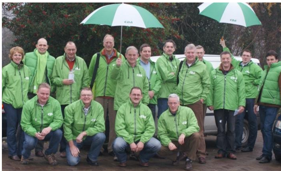
Het Campagneteam is alweer startklaar voor de Tweede Kamer verkiezingen