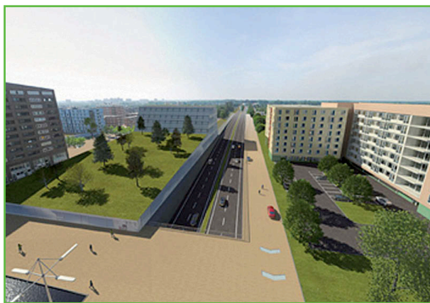
Impressie Hondsrugwegtunnel. Deze impressie geeft niet het eindbeeld weer. Impressie: VIA Drupsteen.

Het bericht dat het plan onhaalbaar bleek sloeg bij het college maar ook bij de raadsfractie in als een bom. Ook de financiële problemen van DPE (dierenpark Emmen) en de steunvraag aan de gemeente waren een tegenvaller. In de zelfreflexie die daarop volgde bleek dat college en raad zich maximaal zouden moeten oprekken maar niet ten koste van alles. Daarbij is niet over een nacht ijs gegaan. Ondertussen deed een deel van de oppositie ook nog