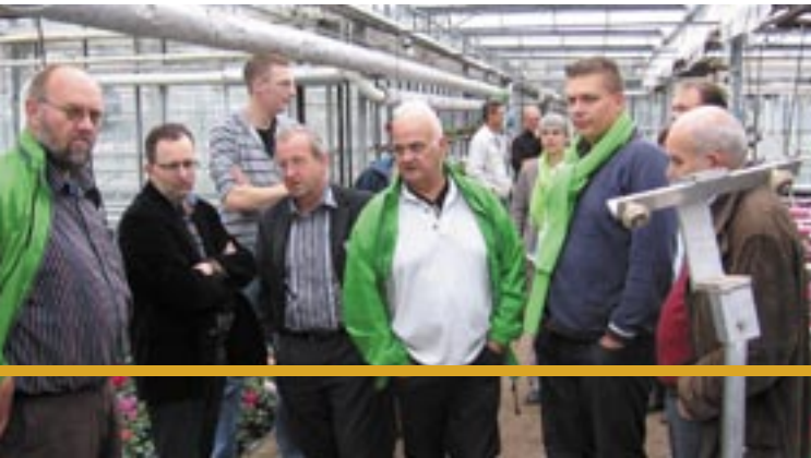
Kassen, Noordse Buurt

is zeker zeer ambitieus opgesteld. Het is ingewikkeld omdat drie doelen tot één plan gesmeed zijn.