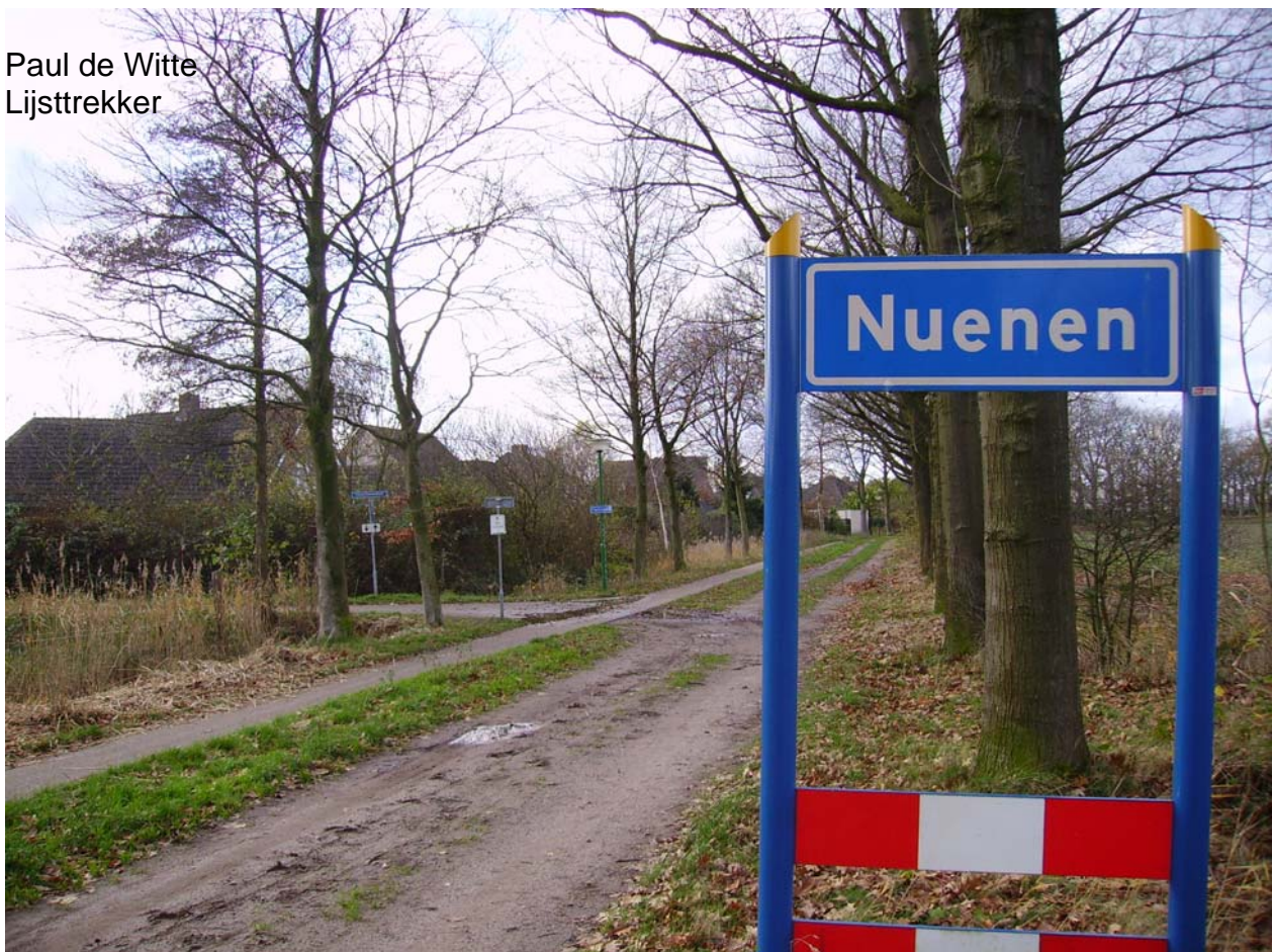
Paul de Witte Lijsttrekker

Als het aan het CDA ligt, is en blijft Nuenen “Een dorp in beweging”, gekenmerkt door een creatief, zakelijk en transparant beleid.