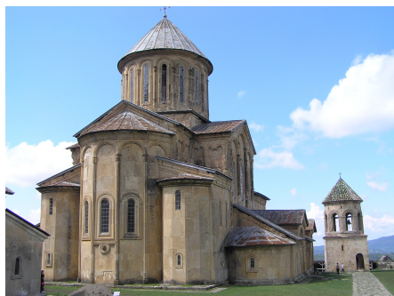
Het oosters-orthodox Gelati-klooster uit de 12e eeuw; omgeving Kutaisi, Georgië

E r is grote onrust ontstaan onder velen over de gevolgen van de bezuinigingen. Het is begrijpelijk dat mensen die afhankelijk zijn van zorg zich ongerust maken gezien berichten in de media. Kan ik straks voldoende zorg inkoop, krijg ik de goede hulp die ik nodig heb? Het tij is zich aan het keren. We zijn eraan gewend geraakt dat er voldoende geld beschikbaar was voor zorg, cultuur, sport, enz. En of dat allemaal nog niet ge-