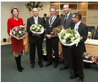
burgemeester en wethouders

doorhakken van knopen. Eigenlijk is de situatie nauwelijks veranderd. We hebben een nieuw College, met bijna dezelfde samenstelling van VVD, PvdA en CDA als in de afgelopen 4 jaar. Had Job Cohen maar eens gekeken naar het succesvolle Purmerendse coalitiemodel, dat nu verder uitgebreid is met de Stadspartij.