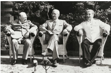
vlnr: Churchill, Truman en Stalin

N a het op afstand bezichtigen van het eenvoudige en goed bewaakte appartement van Angela Merkel volgen de obligate excursies zoals naar Cecilienhof alwaar de grote drie – Truman, Churchill en Stalin – elkaar ontmoetten bij de Conferentie van Potsdam.