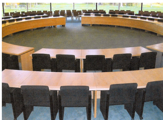
de Raadszaal van Purmerend

Het bestuur van de gemeente moet op sommige terreinen leiding geven door toekomstgerichte visies te ontwikkelen op de lokale samenleving, door normen te stellen en op eigentijdse wijze gezagvol op te treden.