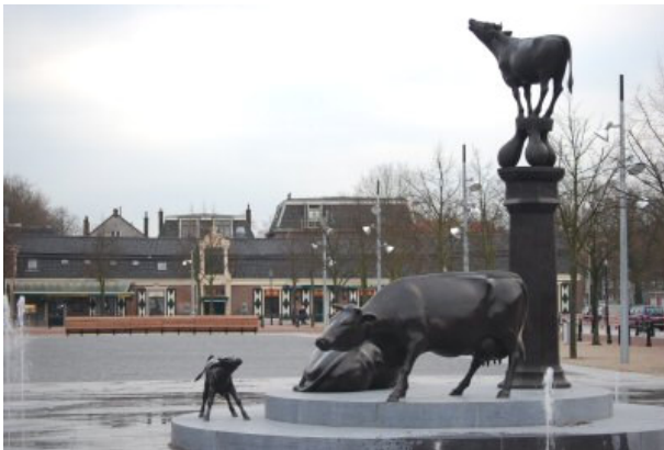
standbeeld op de vernieuwde Koemarkt

De bebouwde omgeving heeft een grote invloed op de mens. Daarbij gaat het niet alleen om de bebouwing zelf, maar ook om de inrichting tot in details toe, de inbedding in het groen en de vormgeving van het stratenpatroon. De welstand dient dan ook een gemeentelijke prioriteit te zijn bij alle ruimtelijke ingrepen. Het stadsbeeld moet een bepaalde kwaliteit uitstralen. Het verdient aanbeveling het karakter en de identiteit van de stad in kaart te brengen waarbij speciaal gelet wordt op gebruikte materialen, ruimte voor allerlei kunstvormen en het speelse karakter van de openbare ruimte (beeldkwaliteitsplan).