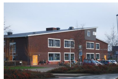
Brede School De Kraal

Het CDA staat voor vrijheid binnen de grenzen van de persoonlijke verantwoordelijkheid. Vrijheid van meningsuiting, van godsdienst en van onderwijs zijn belangrijke pijlers van het CDA beleid, zoals in de Grondwet is vastgelegd.