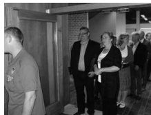
Gewoon op je heurt wachten

Onder grote belangstelling en de daarbij passende rij ontdekte ik de burgemeester van Huinen. Aangezien wij elkaar kennen was de begroeting hartelijk. Samen met zijn echtgenote moest hij braaf op zijn buurt wachten om burgemeester van Putten de hand te schudden. Toen het moment daar was, werd een stevige hand geschud. Of ze mekaar kenden, een uitvoerig gesprek volgde en na enkele minuten kwam dan toch het afscheid. Hoe het nu verder moet met de veiligheid in Huinen blijft in raadselel gehuld. Maar deze burgemeester laat zich niet zo maar het bos in sturen en knoopte al snel een gesprek aan met de CDA-fractievoorzitter. Wie weet komt het dan toch nog goed.