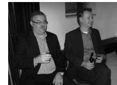
Met de fractievoorzitter kom je er altijd uit