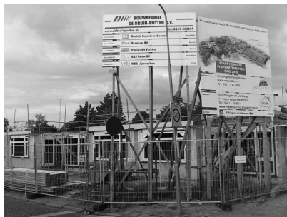
Bouwactiviteiten aan de Brinkstraat