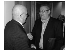
Burgemeester ontmoet burgemeester