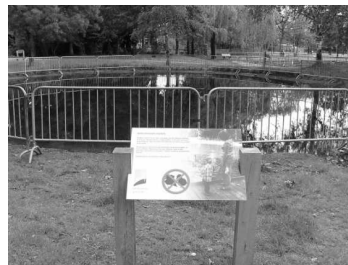
Veiligheid boven alles in de Groene Scheg

Daarna zijn we met vakantie naar Zeeland gegaan, waar het weer uitstekend was en de dagen te kort. Wandelen, fietsen, een WK-wedstrijdje kijken, lezen, strand en zee, prima. En als dan na thuiskomst blijkt dat de raad het college toch gedwongen heeft een afrastering rond de vijver in de gerenoveerde Groene Scheg te plaatsen geeft dat de zomer extra glans. Nu de fietstunnel bij Terra Nova nog.