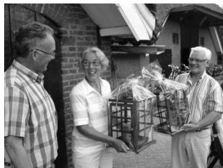
De voorzitter bedankt de ex-voorzitter