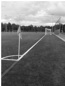
Eindelijk kunstgras voor SDCP