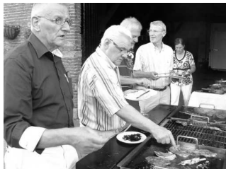
Samen aan de traditionele CDA-barbecue