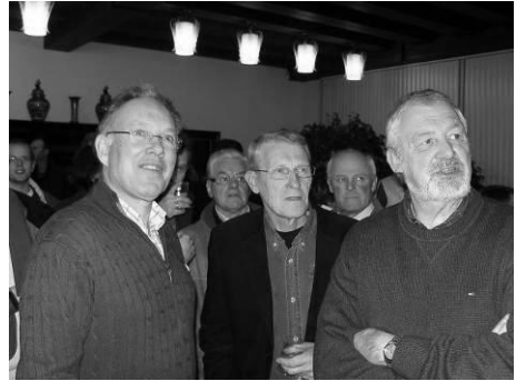
Uitslag tijdens verkiezing gemeenteraad