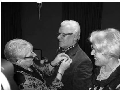
Tijdens ledenvergadering "geridderd"