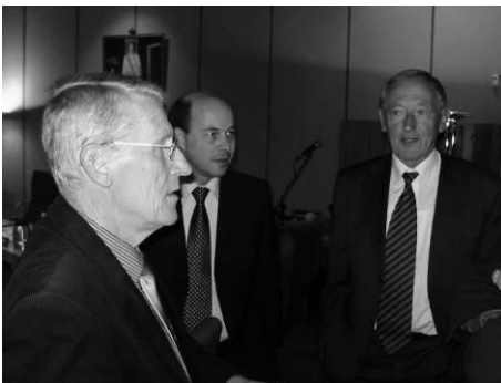
Zwijgen als het moet en afwachten maar