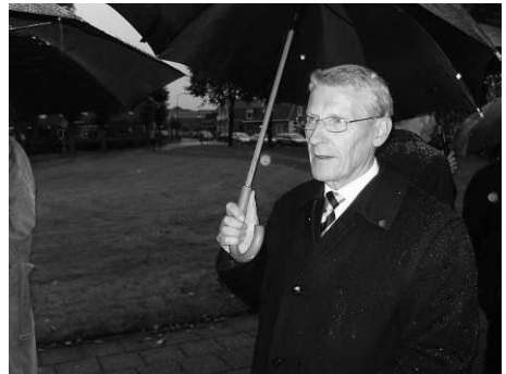
CDA prominenten aanwezig tijdens de herdenking van de razzia 2 oktober 2010

U moet dit niet zien/horen als een klaagzang, maar ik wil nog weer eens duidelijk maken dat er ook voor een oppositiepartij in Putten volop politiek werk te doen is. Gelukkig is er