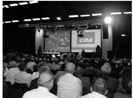
Volle bak in Arnhem zoals velen weten