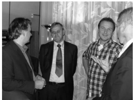
Kwestie van Lagen maakte de tongen los