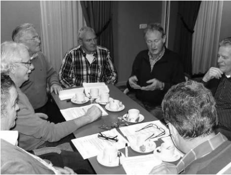
Evaluatie tijdens de ledenvergadering

Over de uitslag van de gemeenteraadsverkiezingen mochten we tevreden zijn met in het achterhoofd de ontwikkelingen van het CDA landelijk. Wij handhaafden ons netjes met vier zetels in de nieuwe gemeenteraad. Opvallend was het goede resultaat van Wij Putten die ineens met vier zetels in de raad kwam. Dankzij de lijstverbinding die wij met de CU en SGP waren aangegaan behaalden de drie christelijk partijen een meerderheid van elf zetels. De CU werd door de lijstverbinding de grootste partij en kreeg de regie in de collegeonderhandelingen. Tot zover allemaal enigszins tevreden gezichten bij het CDA.