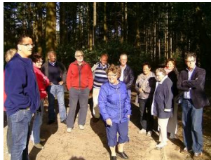
CDA-Barbecue met een wandeling en educatief moment