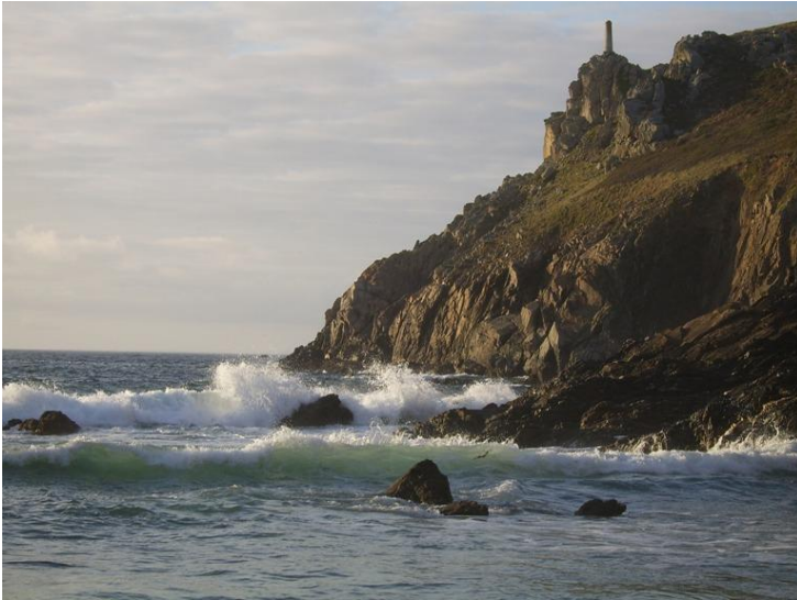
Foto: rotskust Bretagne.

In de oceaan bij Bretagne viel me op dat er op sommige plekken bakens waren opgericht die er blijkbaar al vele jaren stonden. Zo midden in de oceaan. Die bakens moeten heel wat stormen hebben doorstaan. Het opvallende van die bakens was dat ze op rotsen zijn gebouwd. De verlichte bakens of vuurtorens midden in de oceaan en op uiteinden van landtongen laten zien waar je bent, aan de hand van die bakens kun je je koers bepalen. Zelfs wanneer een stormvloed over de oceaan waait.