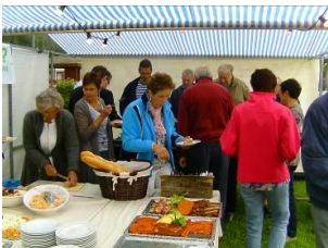
Met veel aandacht wordt het vlees klaargemaakt