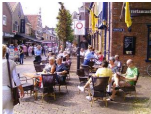
Foto: Een goed bezet terras bij De Heerd