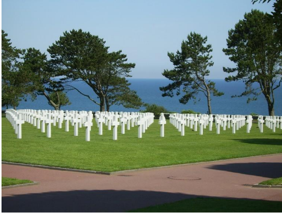
Foto: Amerikaanse begraafplaats bij Omaha Beach in Normandië.