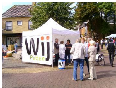
Wij Putten opnieuw de straat op