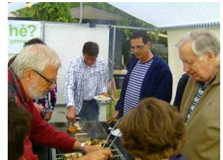
De jaarlijkse CDA-Barbecue gaat er goed in.