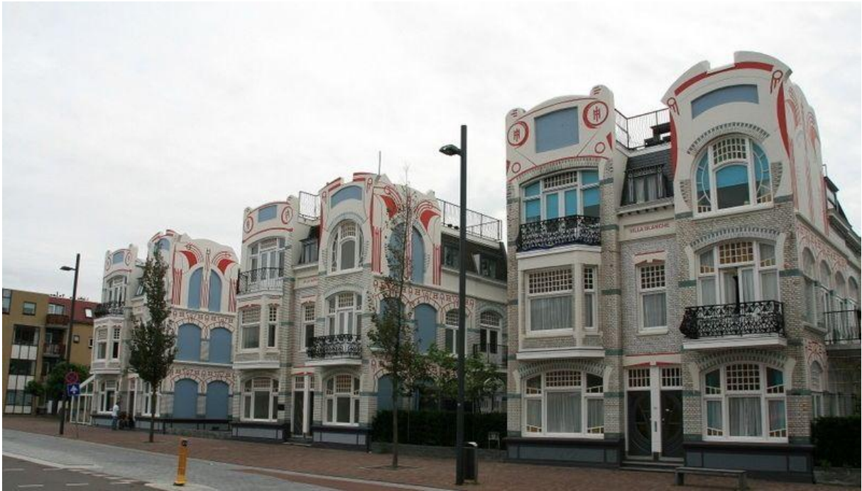
Gerestaureerde loodshuizen in de Spuistraat

Alle geleerden zijn het erover eens, dat bekende begrippen als groei en uitbreiding moeten worden vervangen door verbetering en verduurzaming ( Niet Meer Maar Beter ). Dat speelt op de plaatselijke woningmarkt, op het gebied van de integratie en participatie van bevolkingsgroepen en in het sociale beleid om ook de zwakkeren bij de samenleving te betrekken. Op sommige ontwikkelingen zal voor de eerste vier jaar zelfs de rem moeten worden gezet. Niet om vooruitgang tegen te houden, maar om te voorkomen dat we voorzieningen kwijt raken en de lasten worden verzwaard voor zaken waarop niemand zit te wachten of waar geen ondernemer brood in ziet.