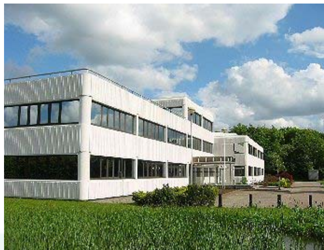
Het gemeentehuis aan de Rading 1 blijft sober

De coalitie wil de inhuur van externen zoveel mogelijk beperken. Wel zal externe inhuur noodzakelijk zijn voor de uitvoering van (woningbouw)projecten. De kosten hiervoor zullen ten laste komen van de betreffende projecten.