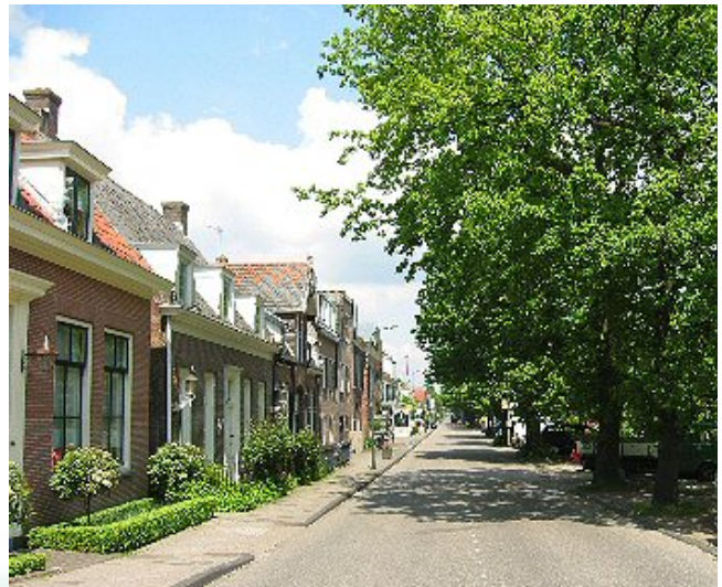
De coalitie wil doorgaand vrachtverkeer weren

De coalitie wil geen betaald parkeren in Wijdmeren. Er wordt een parkeervonds opgericht waaruit parkeervoorzieningen voor probleemgebieden (bijvoorbeeld Oud-Loosdrecht) gefinancierd kunnen worden. Ondernemers met te weinig parkeergelegenheid op eigen terrein dragen bij in het fonds. De gemeente faciliteert de instelling en het beheer van dit parkeervonds.