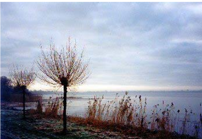
De coalitie blijft tegen verdiepingen in de Loosdrechtse Plassen

Het oplossen van de waterproblematiek wordt in één plan verrat, welke in samenspraak met bewoners en gebruikers van de polder wordt opgesteld. Hierbij gelden de randvoorwaarden Duidelijk (voor betrokkenen) Droog (geen wateroverlast) en Duurzaam (beproefde langetermijn oplossing). de gemeente neemt pro-actief deel in de gebiedscommissie.