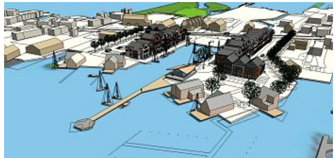
Reeds ingezette projecten wil de coalitie verder uitvoeren, zo ook het nieuwe Dorpscentrum Oud-Loosdrecht