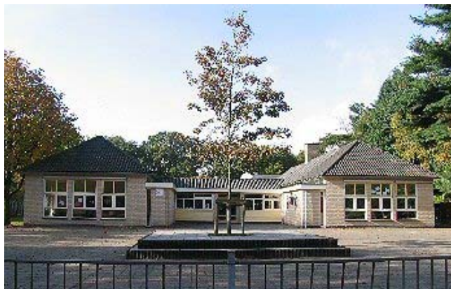
De coalitie wil dat kinderen veilig naar school kunnen

Bij het afschaffen van regels en vergunningen zal ook zeer kritisch gekeken worden naar de vergunningen op het gebied van veiligheid. De coalitie staat een streng en rechtvaardig handhavingsbeleid voor.