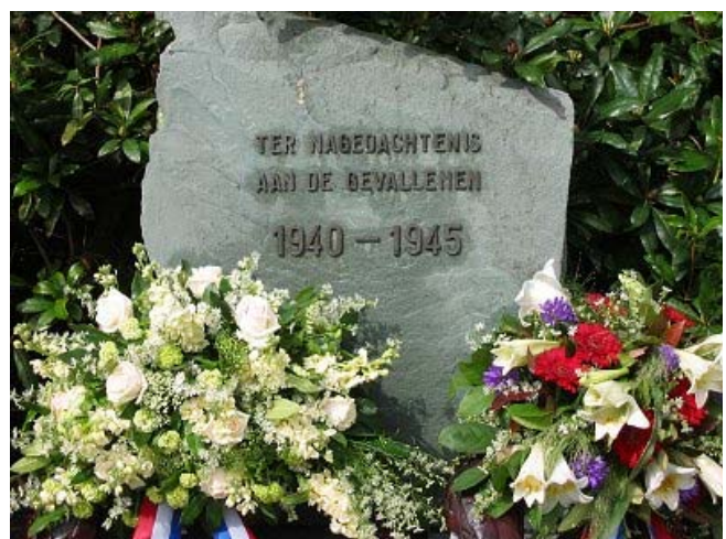
Er komt een waardige alternatieve locatie voor het oorlogsmonument in 's-Graveland

Er dient een waardig alternatief te komen voor de plek van het oorlogsmonument in 's-Graveland