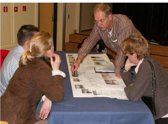
De coalitie wil bij herinrichtingen van openbare ruimten omwonenden actief en in een vroeg stadium betrekken

De gemeente zal regelmatig communiceren naar de inwoners welke inspanningen hiervoor gedaan worden.