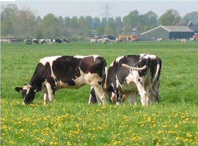
In Wijdmeren zijn woningbouwlocaties schaars. Bouwen mag alleen binnen de daartoe aangewezen gebieden, de zogenaamde rode contouren.

Woningbouw is één van de speerpunten van deze coalitie. De reeds ingezette projecten zullen verder uitgevoerd worden. Daarbij is draagvlak van omwonenden van belang. Te denken valt aan de A. Voetlaan in Ankeveen, het Plutoterrein in 's-Graveland, de Kerklaan in Kortenhoef, het dorpscentrum in Loosdrecht en Venenburg en de Voorstraat en de sportvelden in Nederhorst den Berg. Wat betreft de sportvelden in Nederhorst den Berg wil de coalitie dat voor het einde van 2010 wordt gestart met de bouw. De coalitie zet zich onverminderd in voor woningbouw (en bij behorende voorzieningen) op Ter Sype. Ook zullen plannen voor Zuidsingel fase 8 en Groenewoud ontwikkeld worden. De kwaliteit van de groene ruimte kan worden vergroot door de aanleg van nieuw groen in de vorm van nieuwe landgoederen, bestemd voor wonen en/of werken. Om het groen te realiseren is een beperkte mate van bebouwing mogelijk onder het motto: "rood betaalt voor groen". In dit kader worden op bescheiden schaal nieuwe locaties in het groen ontwikkeld.