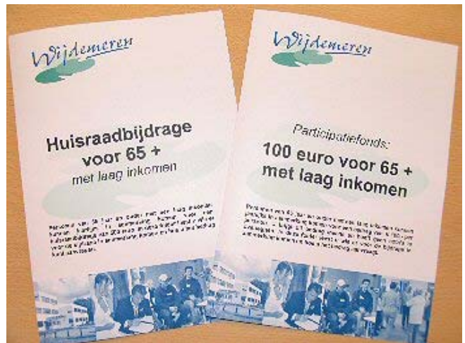
De coalitiepartijen willen het minimabeleid meer onder de aandacht brengen

De coalitie wil dat alleenstaande ouders van kinderen tot 12 jaar ontheffing kunnen krijgen van de sollicitatieplicht.